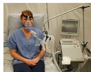
Neinvazivní přetlaková plicní ventilace (NPPV, NIV)