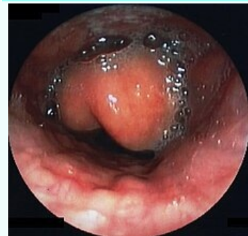
Endoskopický obraz epiglottitidy