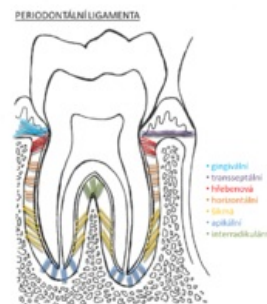
Struktura vazivových vláken kotvících zub.

Mezi parodontálními vazy probíhají lymfatické a krevní cévy a také nervová vlákna s volnými nervovými zakončeními, která reflexním mechanismem chrání zub před přetížením.