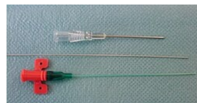
Arteriální katetr pro Seldingerovu techniku