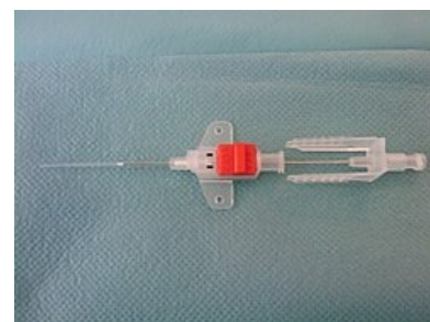
Arteriální katetr pro „over the needle“ techniku

Při jakékoli další manipulaci s celým systémem se snažíme dodržet sterilní postup.