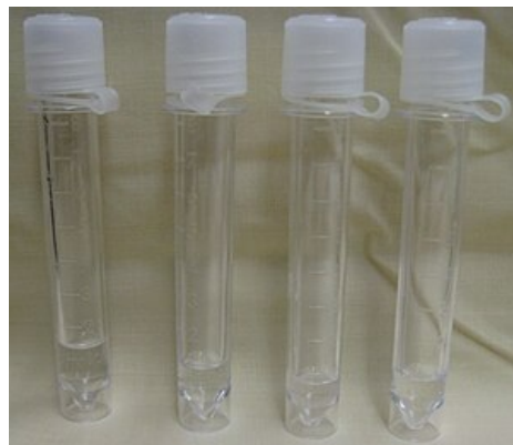
Fyziologický čirý bezbarvý likvor