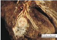
Spinocelulární plicní karcinom