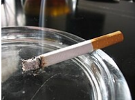
Cigarety – plicní zabiják