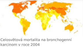
Celosvětová mortalita na bronchogenní karcinom v roce 2004