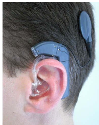
Implantovaná kochleární neuroprotéza