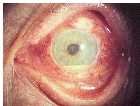
Akutní iritida a hypopyon