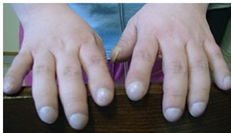
Paličkovité prsty u pacienta s Eisenmengerovým syndromem