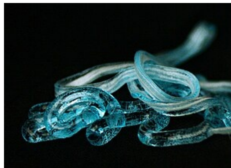
Příklad koloidu tvořícího gel