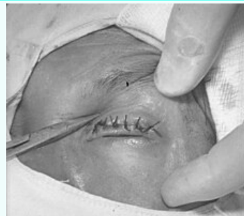
Entropium a trichiazie způsobené trachomem.

Klinický obraz postavení okrajů očního víčka, při které okraj víčka s řasami směřuje proti povrchu bulbu