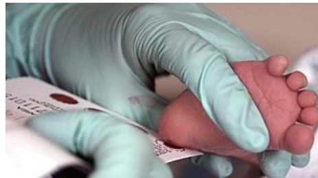
Novorozenecký screening – odběr z patičky novorozence