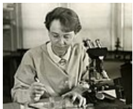
Barbara McClintock (1902–1992)