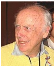
James Dewey Watson (1928)