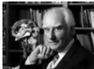
Francis Harry Compton Crick (1916–2004)