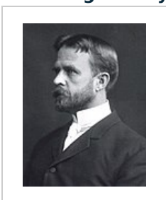
Thomas Hunt Morgan (1866–1945)