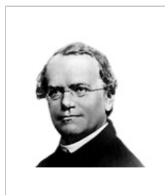
Johann Gregor Mendel (1822–1884)