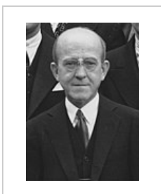
Oswald Theodore Avery (1877–1955)