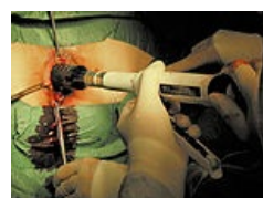
Longova metoda – použitý stapleru