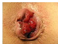
III. stupeň vnitřních hemoroidů