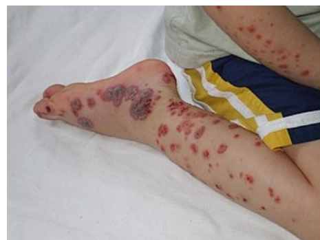
Kožní exantém při vážnějším projevu HSP

Medscape 984105 ( https://emedicine.medscape.com/article/984105-overview )