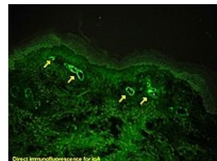
Přímá imunofluorescence IgA v glomerulu