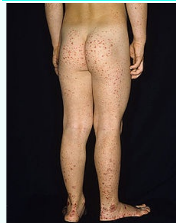
Henochova-Schönleinova purpura s typickým exantémem především nad extenzory dolních končetin

Původce často následuje po infekci dýchacích cest