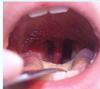
Herpangína – otok a ulcerace na uvule