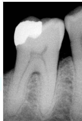
Amalgámová plomba na RTG snímku, která může sloužit při identifikaci neznámého zemřelého

Identita bezpečně prokázána – identita nelze vyloučit – identita vyloučena.