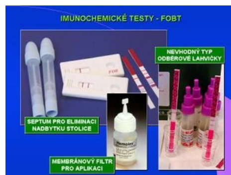
Imunochemické testy – FOBT

Studie v posledních letech testují několik imunochemických analyzátorů pro kvantitativní stanovení hemoglobinu ve stolici (qi-FOBT), většina je japonské výroby. ROC křivky prokazují specifitu pro pokročilé adenomy 95,3 % při citlivosti 100 ng Hb/mL.