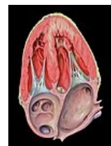
Dysfunkce přední stěny – čtyřdutinová projekce

Mechanické komplikace AIM mohou vést k asymptomatickému či symptomatickému srdečnímu selhání nebo až ke kardiogennímu šoku a případně smrti pacienta. [6]