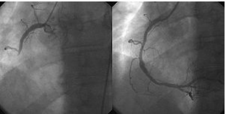
Koronární angiografie a angioplastika u pacienta s AIM: vlevo uzavěr a. coronaria dextra; vpravo a. coronaria dextra po zprůchodnění

Provedení koronárního bypassu (CABG) u pacienta s akutním IM není považováno za standardní léčebnou modalitu. Pro indikaci emergentního CABG musí být splněna kritéria definovaná v klinických guidelines ČKS (htt