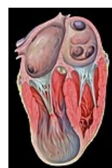
Aneuryzma hrotu levé komory – čtyřdutinová apikální projekce