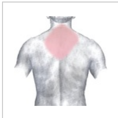
Lokalizace bolesti při AIM