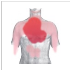
Lokalizace bolesti při AIM