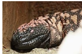
Ze slin korovce jedovatého se izoloval exendin 4 , inkretin, který znamenal přelom pro léčbu analogy