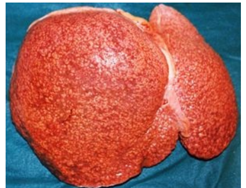
Mikronodulární jaterní cirhóza