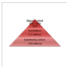
Deficit Vit A.png 933 × 620; 89 KB