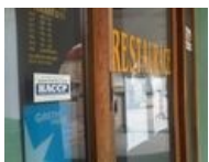
HACCP1.jpg 2,048 × 1,536; 342 KB