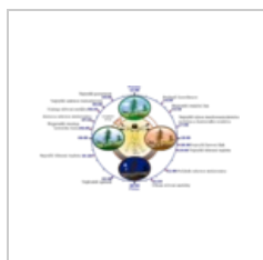
Biological clock h... 1,200 × 620; 264 KB

The following 11 files are in this category, out of 11 total.