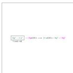
Ca-EDTA.jpg 1,016 × 144; 20 KB