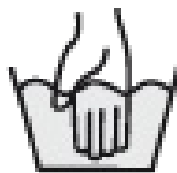
Washsym handw... 50 × 50; 4 KB