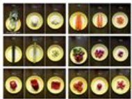
Zelenina.jpg 900 × 675; 308 KB