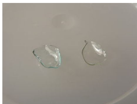
Vysušené kontaktní čočky