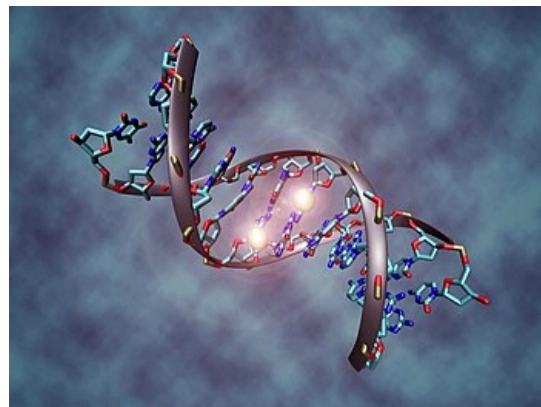
Metylace fragmentu DNA (na dvou cytosinech ve střední části molekuly)

Metylace postihuje téměř výlučně cytosin (v pozici C5) v dinukleotidu CpG (CpG = Cytosin-fosfát-Guanin). Tyto dinukleotidy v kódujících částech genomu jsou potlačeny, pravděpodobně vymizely v evoluci v důsledku velké mutability metylovaného cytosinu. Vyskytují se hojně v repetitivních sekvencích a tzv. ostrůvky CpG jsou akumulované CpG dinukleotidy, které se často vyskytují v oblasti promotoru. Asi 60 % genů má promotory asociované s těmito CpG ostrůvky. Ty jsou nemetylovány u aktivních genů, zde se váží transkripční faktory. Metylace této oblasti je spojena s inaktivací genů , buď metylace brání vazbě transkripčních faktorů, nebo umožňuje vazbu inhibičních komplexů, obsahujících histon deacetylázy a další faktory, které vedou k přestavbě chromatinu do inaktivní podoby. Vazba metylované DNA a inhibičního komplexu (obsahujícího histon deacetylázy) je zprostředkována vazebnými proteiny , jako např. MeCP2. Gen kódující tento protein MeCP2 je mutován u progresivního neurologického postižení – Rettova syndromu. Metylace je zajištěna enzymaticky metyltransferázami, z nichž Dnmt1 je tzv. udržovací metyltransferáza, která metyluje nově vzniklý řetězec DNA při replikaci dle metylačního vzoru starého řetězce, Dnmt3a,b jsou de novo metyltransferázy.