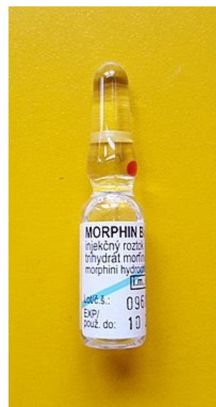
1% morfin k intravenóznímu podání