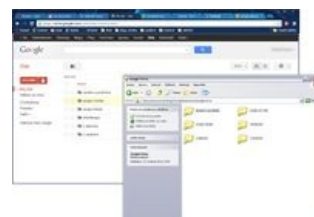
Jak vidíte, na Google disku i v počítači jsou stejné složky

Google disk je nástroj, který umožňuje snadnou správu Google dokumentů. Pokud se rozhodnete Google disk si založit, software, který si nainstalujete vytrhne z vašeho pevného disku 5 GB dat a ta nahraje na internet - do toho výše zmíněného cloudu. Tato operace způsobí, že se ke svým nejdůležitějším datům dostanete z jakéhokoli počítače připojeného k internetu.