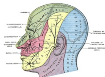
Inervační oblasti větví n. V