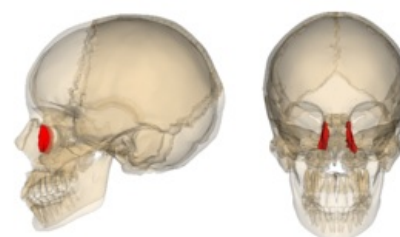
Slzní kost v lebce