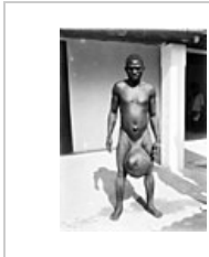
Hydrokéla v důsledku elefantiázy

Jde o místní poruchu krevního oběhu, která však může mít příčinu i mimo kardiovaskulární systém. Následkem otoku vážne výměna vody a živin mezi krví a buňkami, a tak se mění podmínky metabolismu.