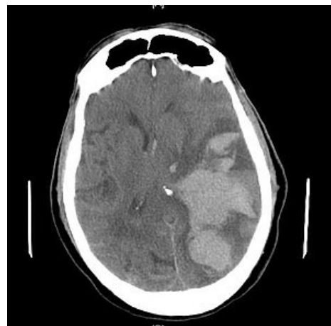
Edém mozku způsobující subfalcinní herniaci