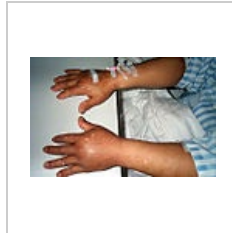
Otok rukou ze stejné příčiny