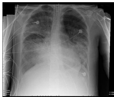
Nekardiální edém plic