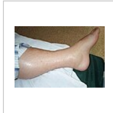
Otok nohy v důsledku syndromu kapilárního úniku indukovaného IL-11