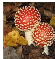
Amanita muscaria – Muchomůrka červená