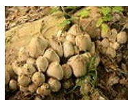
Coprinus atramentarius – Hnojník inkoustový