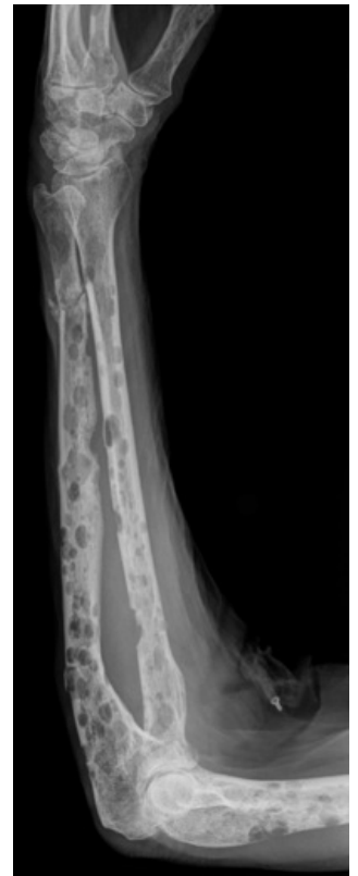
Mnohočetná osteolytická ložiska myelomu