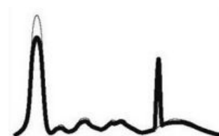
Elektroforéza při monoklonální gamapatii