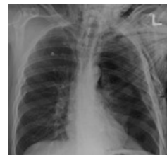
Pneumotorax a pneumomediastinum

Diagnosticky největší hodnotu má CT , pomocí něhož lze v některých případech určit zdroj plynu.