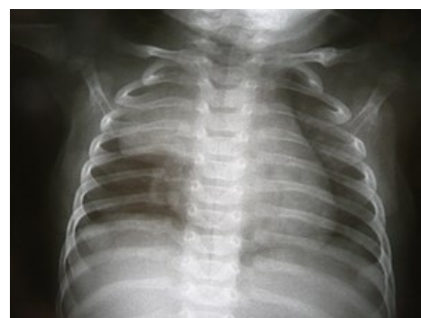
Příznak lodní plachty spinakru (vpravo)