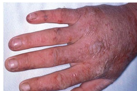
Akutní fotosenzitivní reakce u EPP

Léčba: zmírnění projevů pomocí beta-karotenu, antihistaminik, melanotanu, fototerapie; prevencí je používání ochranného oblečení a speciálních krémů. Na rozdíl od akutních jaterních porfyrií EPP nezhoršují žádné léky.