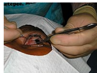
Chirurgické odstránení pterygia