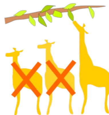
Přírodní výběr v praxi.