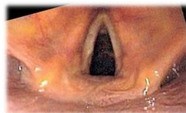
Endoskopický pohled na larynx