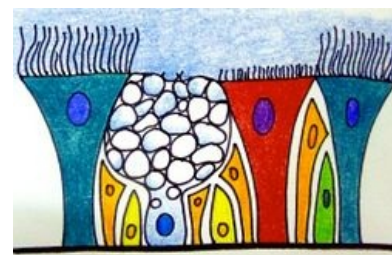
Víceřadý cylindrický epitel dýchacích cest

⚠ Pozor na záměnu epitelu dýchacích cest a respiračního epitelu, který je pouze v alveolech (jednovrstevný dlaždicový epitel).