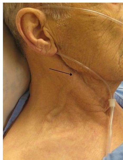
Zvýšená náplň krčních žil