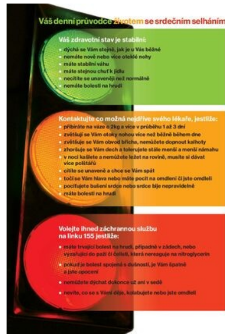
Stručné doporučení pro pacienta se srdečním selháním