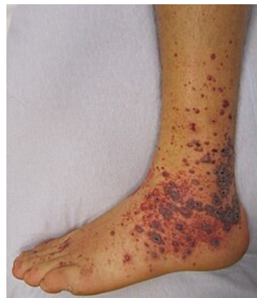
Projevy vaskulitidy na kůži

Onemocnění vzniká v důsledku tvorby imunokomplexů , které se vážou na malé a střední tepny.