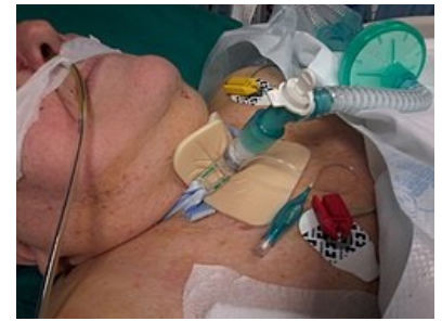
Pacient s tracheostomií

V případě potřeby akutního zajištění dýchacích cest je metodou volby endotracheální intubace, při její nemožnosti se provádí koniotomie nebo koniopunkce, tracheostomie je prováděna až následně, jsou-li pro ni indikace.