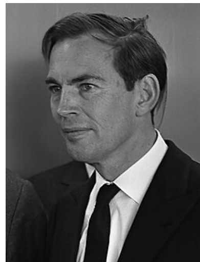
Christiaan Neethling Barnard - první člověk, který provedl transplantaci srdce