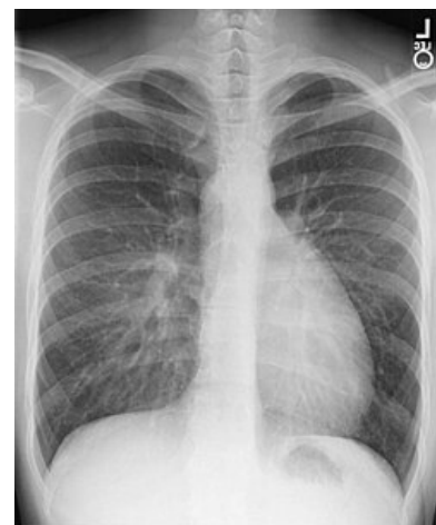
RTG: transpozice velkých tepen