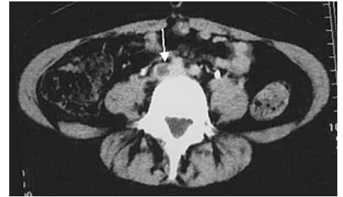
Trombóza společné pánevní tepny (CT)