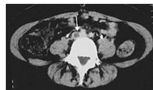
CT hluboké žilní trombózy ve v. iliaca communis

Podrobnější informace naleznete na stránce Antikoagulancia.