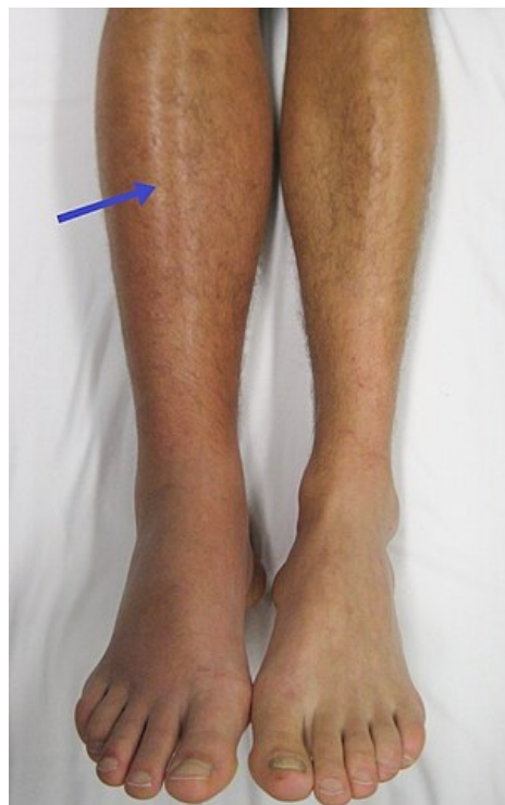
Otok pravé dolní končetiny, lividní zabarvení