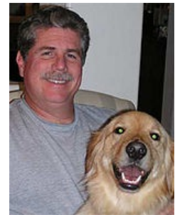
Makroorganismy – člověk, pes

Patogenními mikroorganismy, které mohou způsobit u člověka infekční onemocnění se zabývá lékařská mikrobiologie. Infekce je chorobný stav, kdy dochází k poškození hostitelského makroorganismu mikroorganismem, který narušuje jeho vnitřní prostředí, aby tak získal prostředí prospěšné k vlastnímu růstu a množení. Ne vždy však musí patogen vyvolat onemocnění. Ve většině případů probíhá infekce bez klinických příznaků.