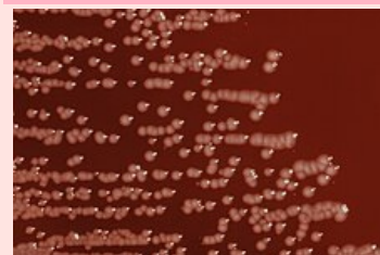
Yersinia enterocolitica na krevním agaru