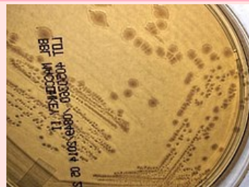
Yersinia pseudotuberculosis na MAC (MacConkey-Agar)