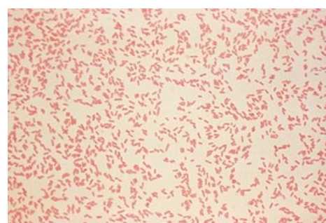
Yersinia enterocolitica pod mikroskopem