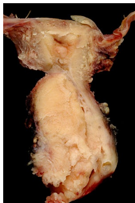
Spinocelulární karcinom děložního hrdla